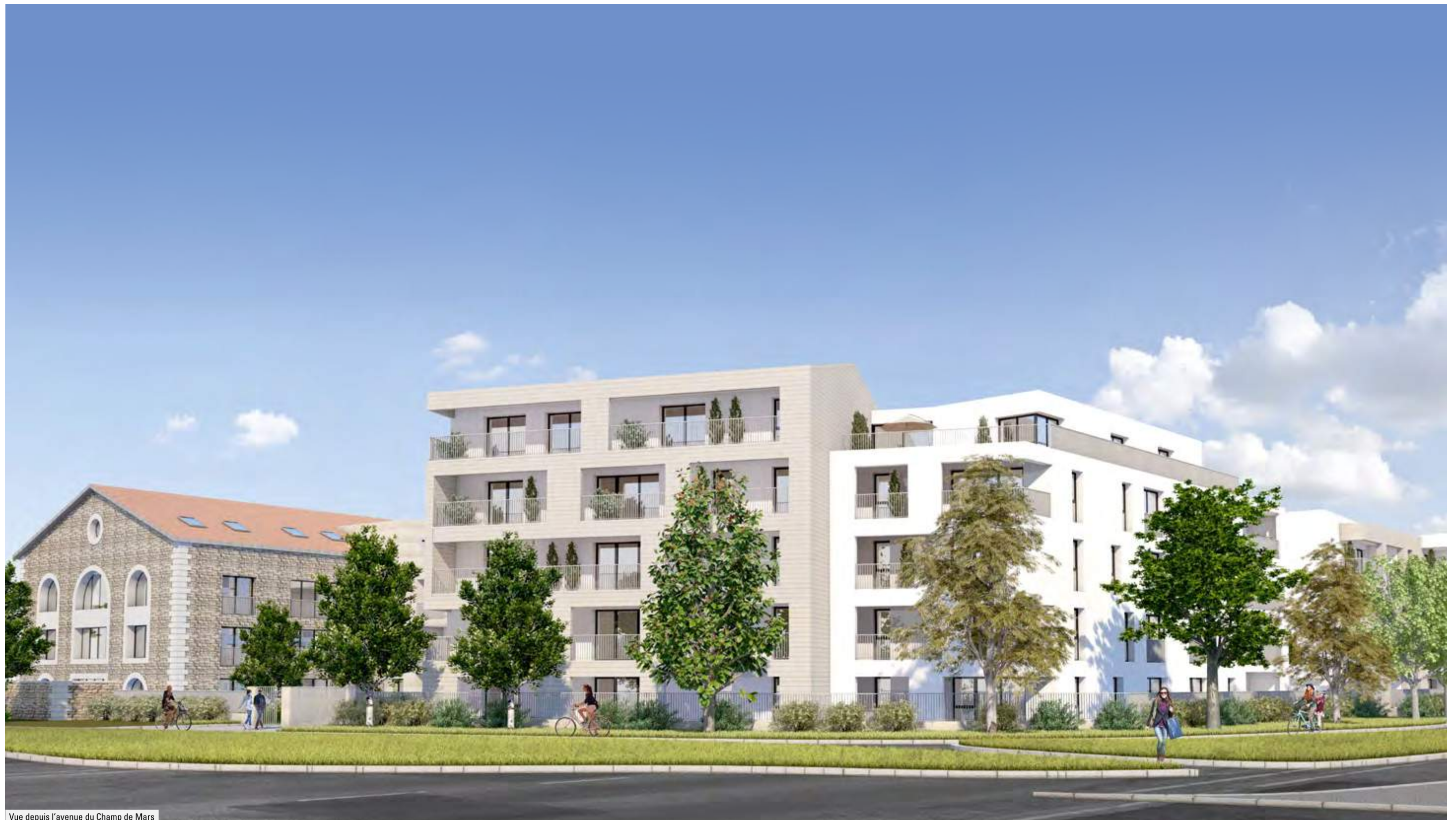
Vue depuis l'avenue du Champ de Mars

Une conception originale alliant authenticité et écriture contemporaine.