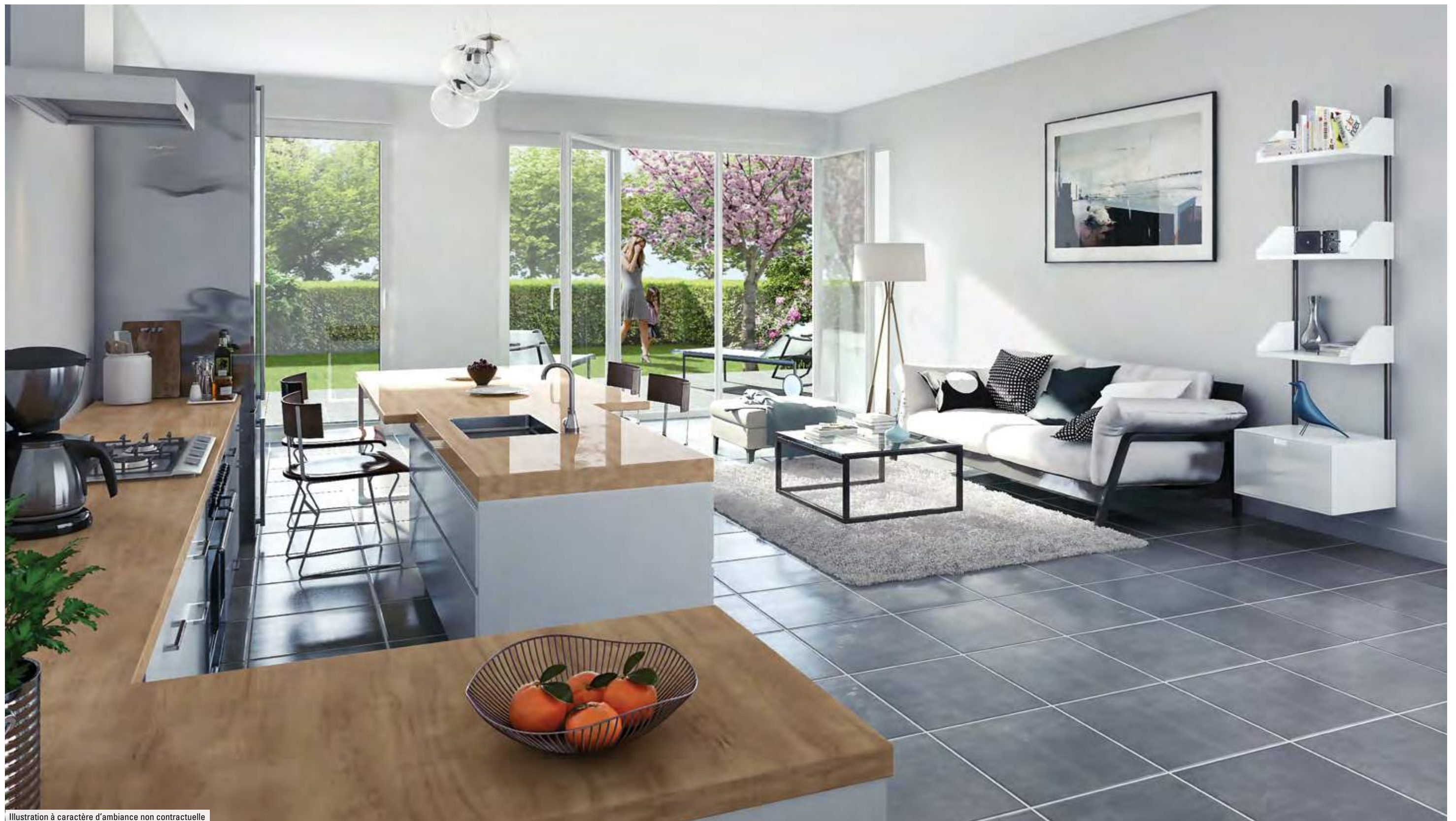
Illustration à caractère d'ambiance non contractuelle

Maison ou appartement, choisissez votre style de vie et votre confort.