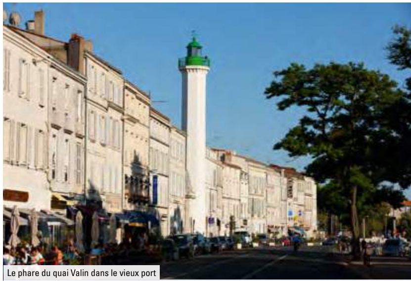
Le phare du quai Valin dans le vieux port