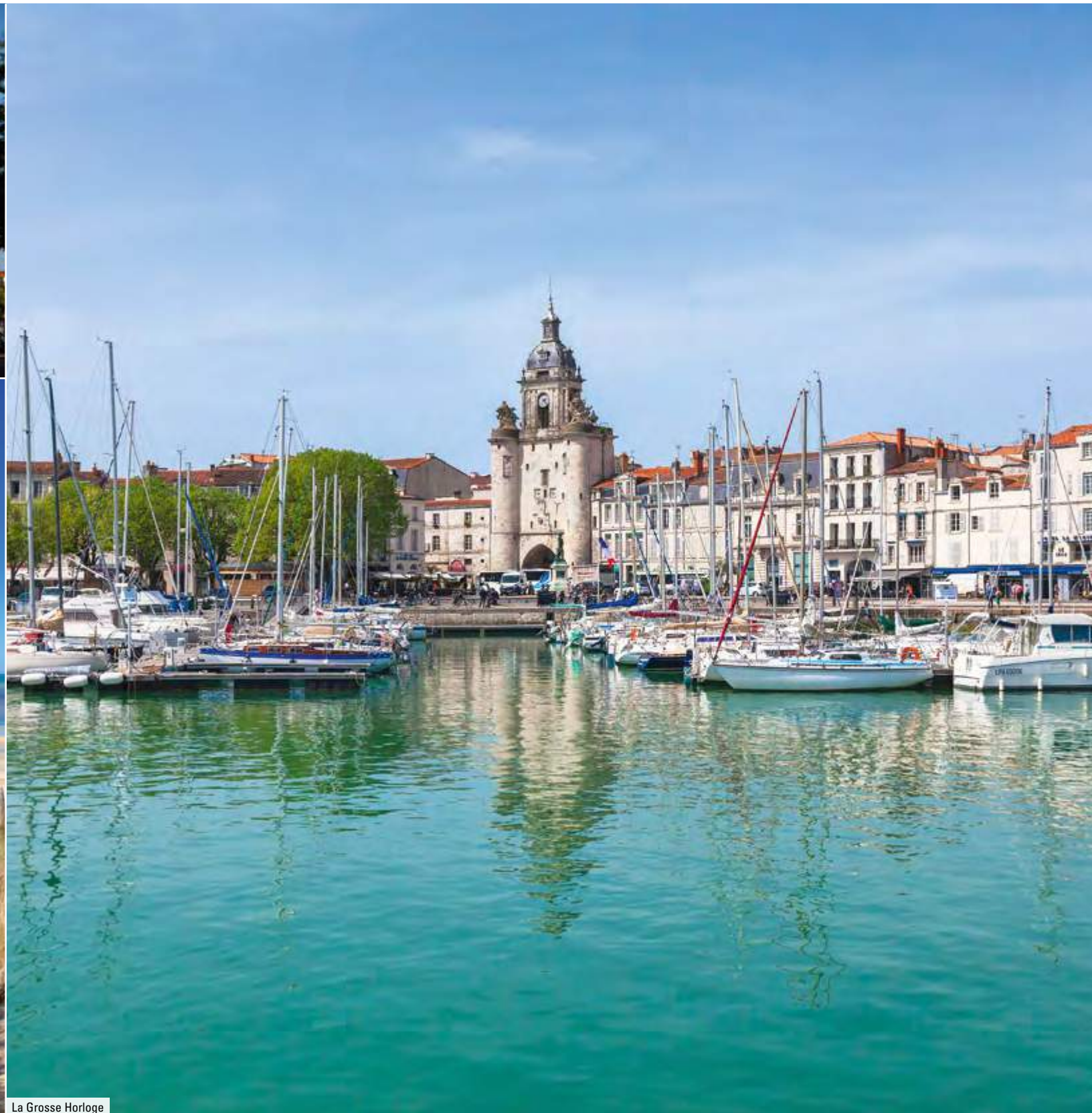
La Grosse Horloge