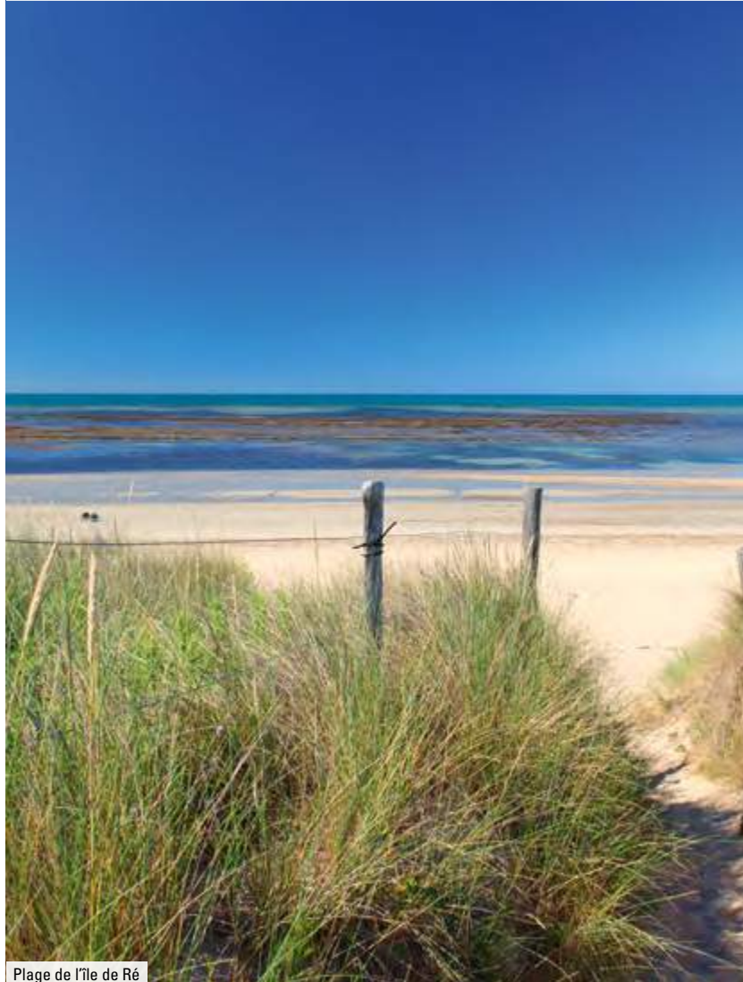
Plage de l'île de Ré