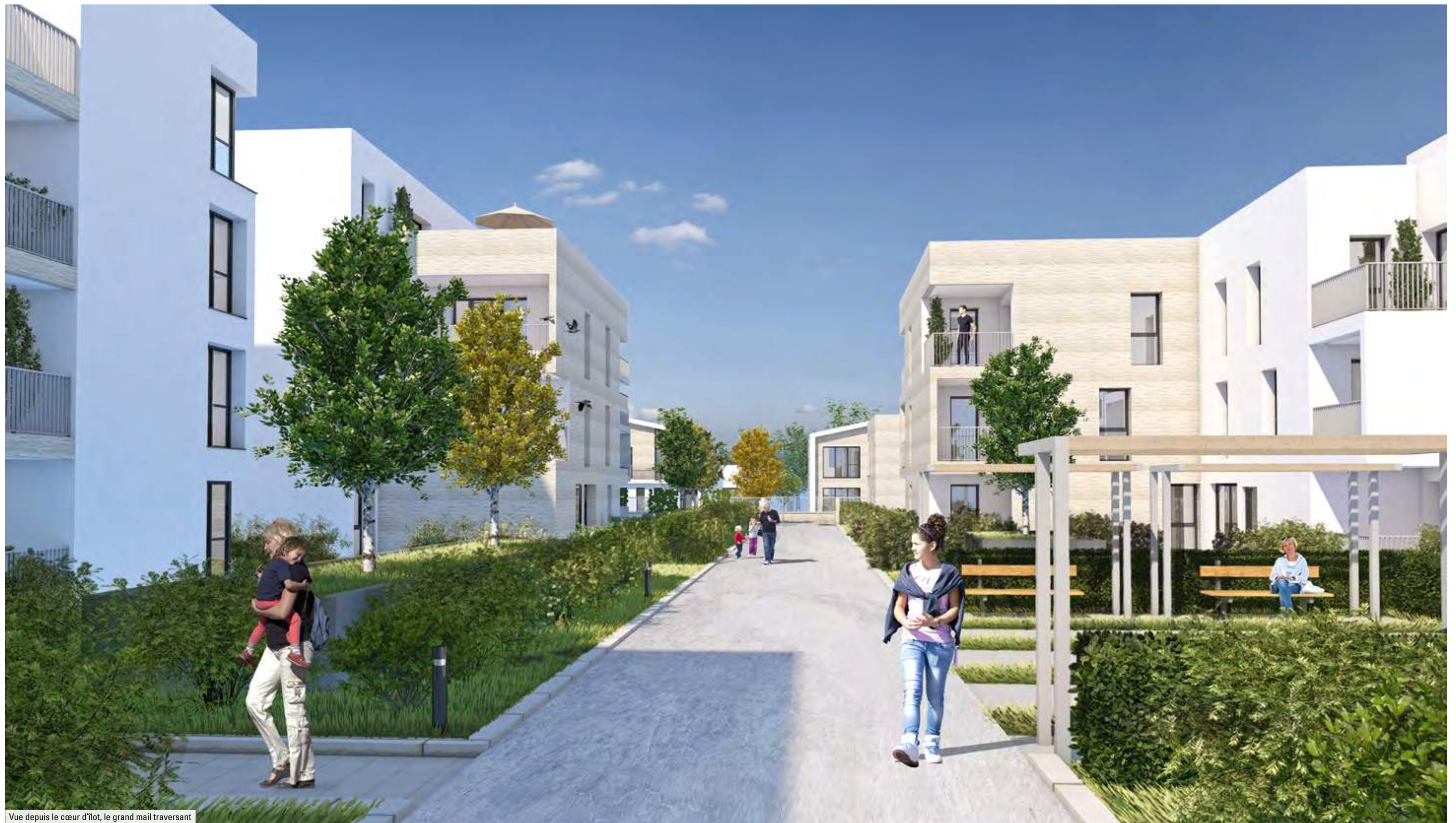
Vue depuis le cœur d'îlot, le grand mail traversant