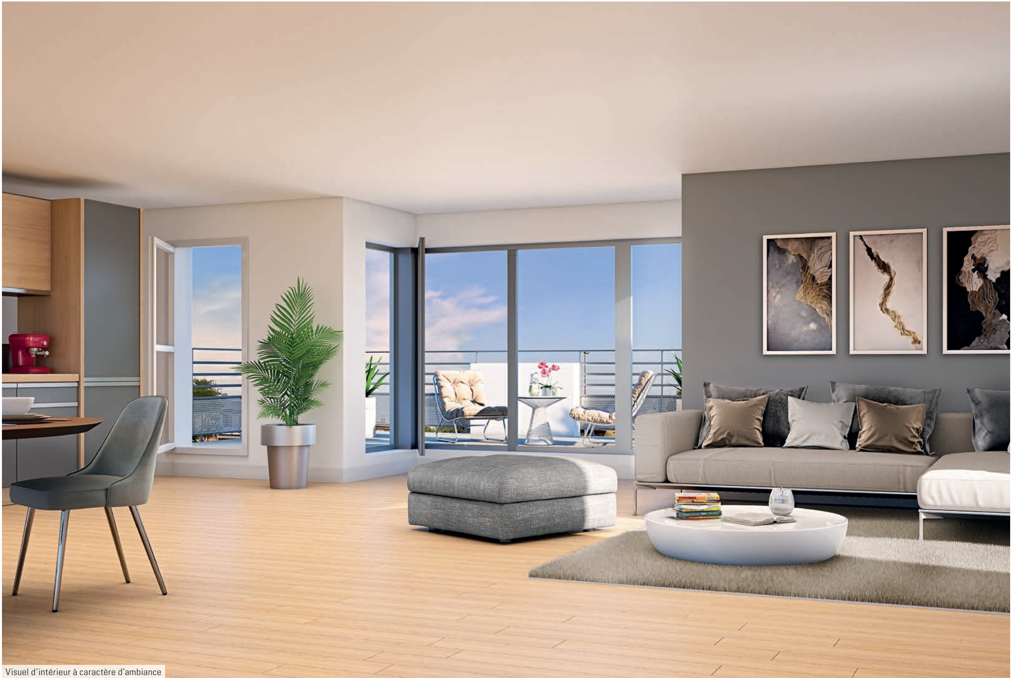
Visuel d'intérieur à caractère d'ambiance