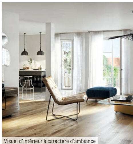
Visuel d'intérieur à caractère d'ambiance